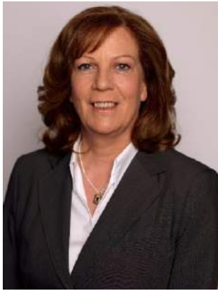
Dr. Birgit Malecha-Nissen, Ihre Bundestagsabgeordnete

Haben Sie Fragen oder Anregungen zu meiner Arbeit als Abgeordnete im Deutschen Bundestag? Dann wenden Sie sich gern jederzeit an mich oder meine Mitarbeiter. Kontakt: