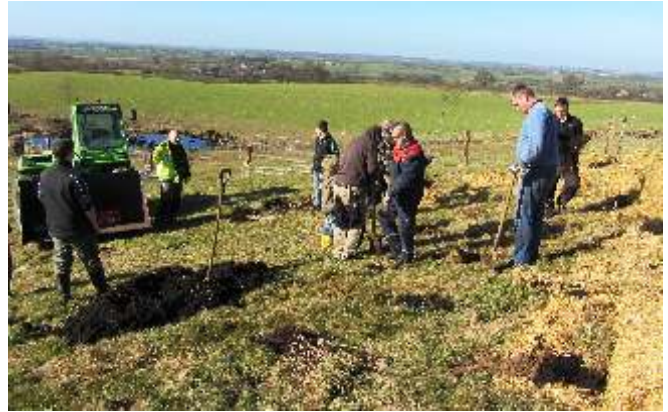
Fleißige Helfer am Fütentrühm