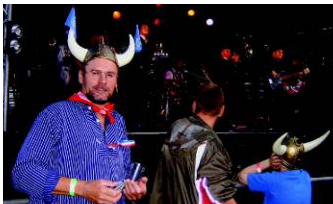
Auch ein Weddelbeker hatte seinen Spaß