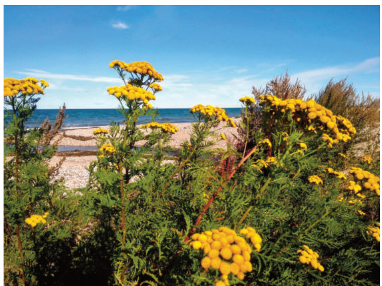
Spätsommer am Zufluss der Mühlenau