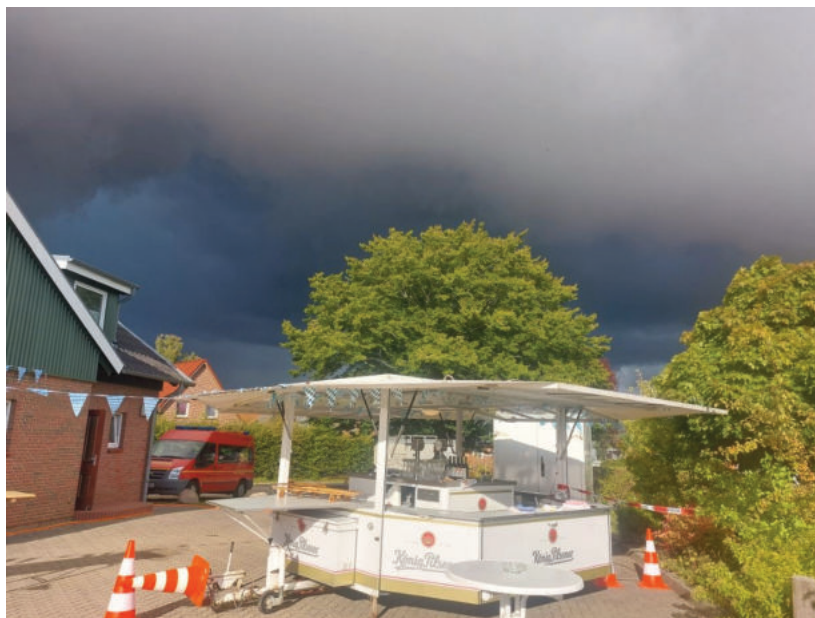
Bedrohliche Wolkenberge über dem Bierpils vor dem Dorfgemeinschaftshaus kündigen das heftige Unwetter an.