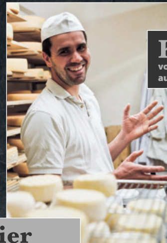
Käse vom HOF BERG aus DANNAU