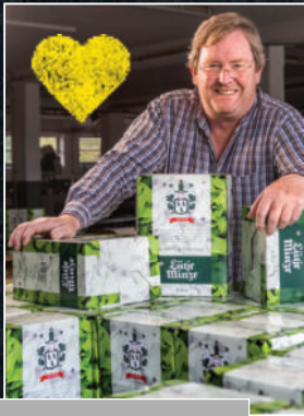
Likör D.H. BOLL SPIRITUOSEN aus LÜTJENBURG