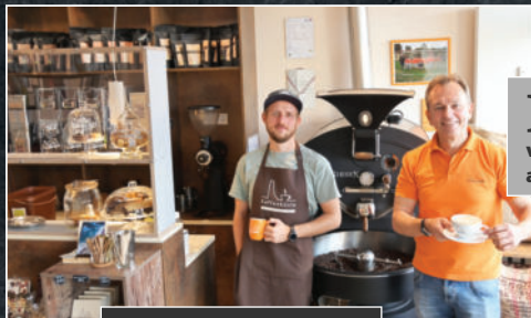
Kaffee von der KAFFEEKÜSTE aus LABOE