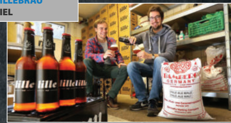
Bier von LILLEBRÄU aus KIEL