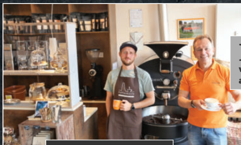
Kaffee von der KAFFEEKÜSTE aus LABOE