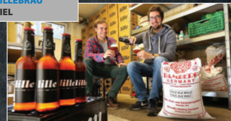
Bier von LILLEBRÄU aus KIEL