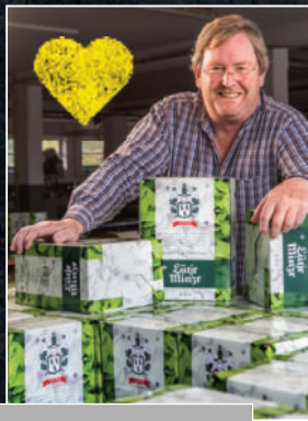
Likör D.H.BOLL. SPIRITUOSEN aus LÜTJENBURG