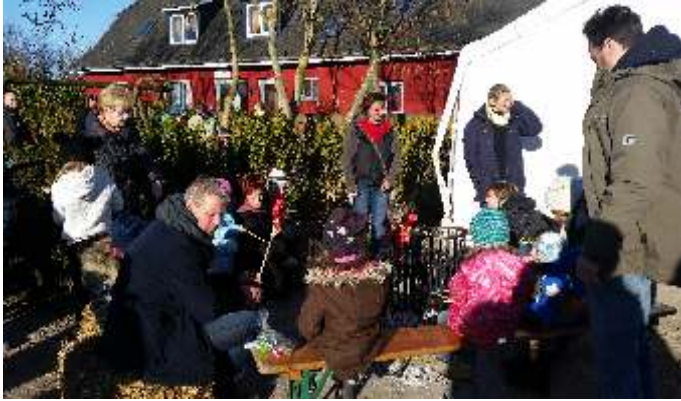
Klein und Groß beim Stockbrot backen.